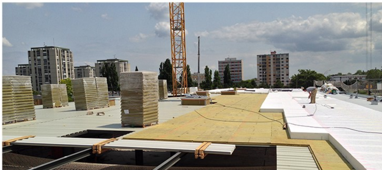
(Chantier CCFO Dijon - 8 000 m 2 )